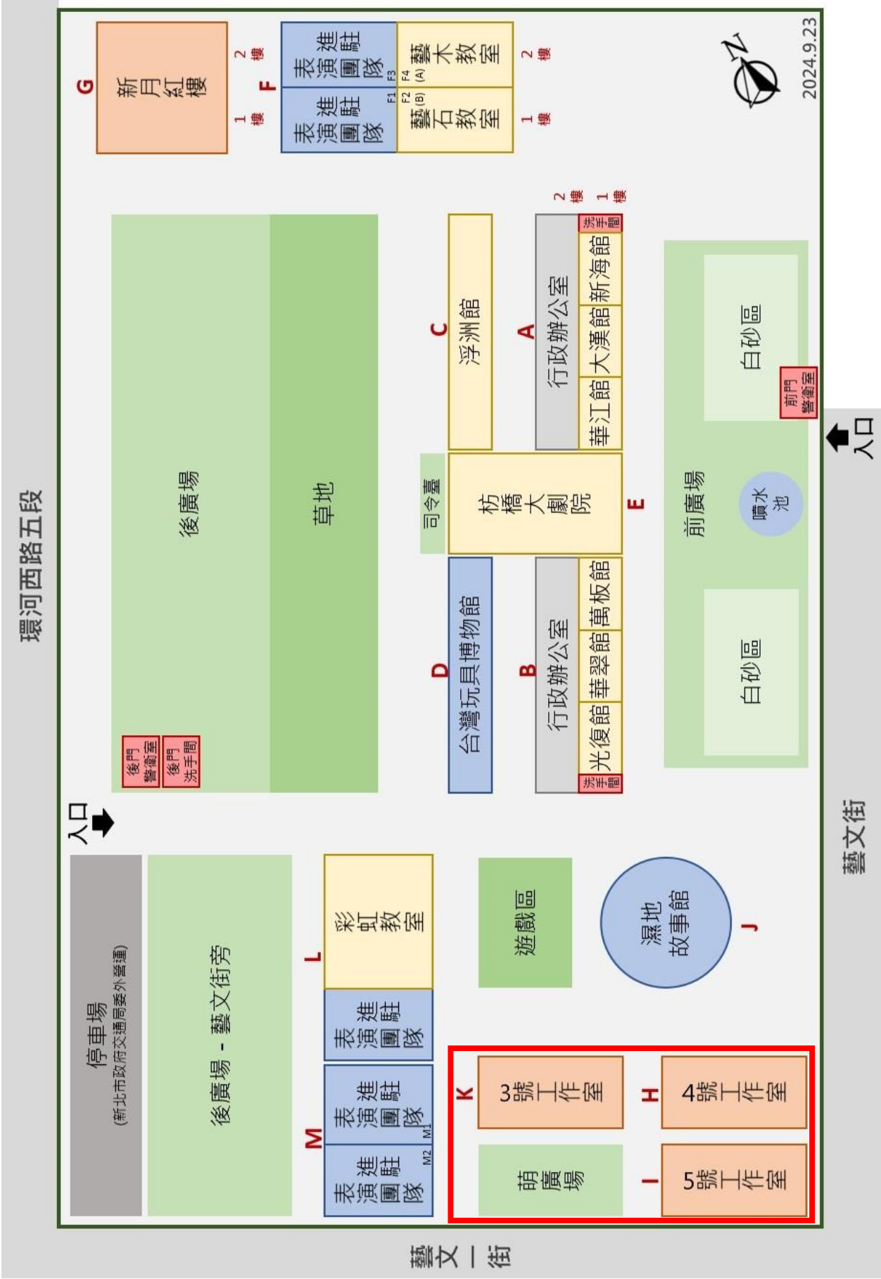
【附件 1】進駐空間位置平面示意圖